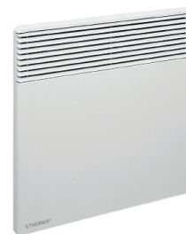
SERENA ECO 500W